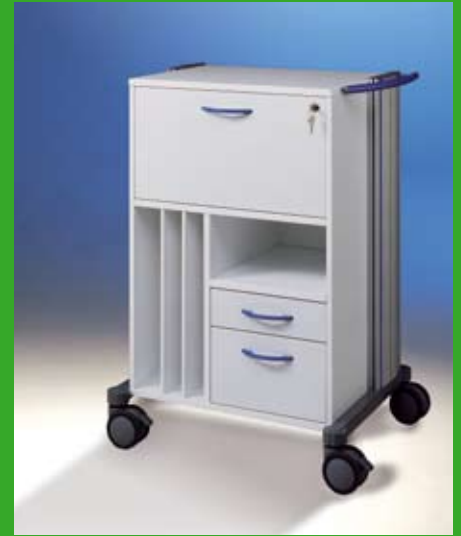
swingo ® -visit Visitenwagen 1 Ref.-Nr. 1355. + Farbziffer

Auf Anfrage bieten wir auch Sonderfarben an