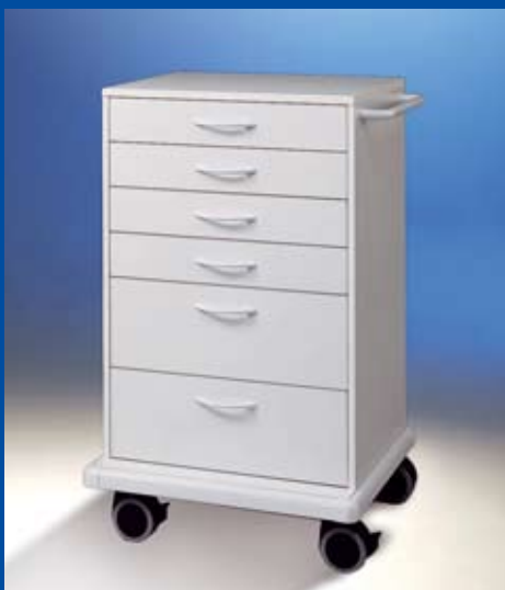
Hospicar ® Medikamentenwagen Ref.-Nr. 14181