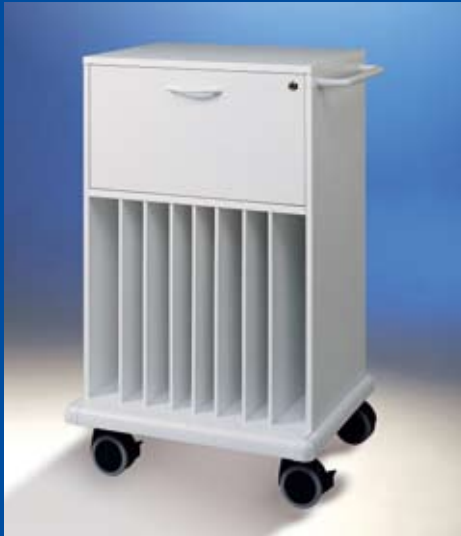
Hospicar ® Visitenwagen 3 Ref.-Nr. 14178