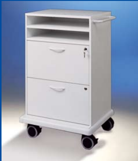
Hospicar ® Visitenwagen 5 Ref.-Nr. 14180