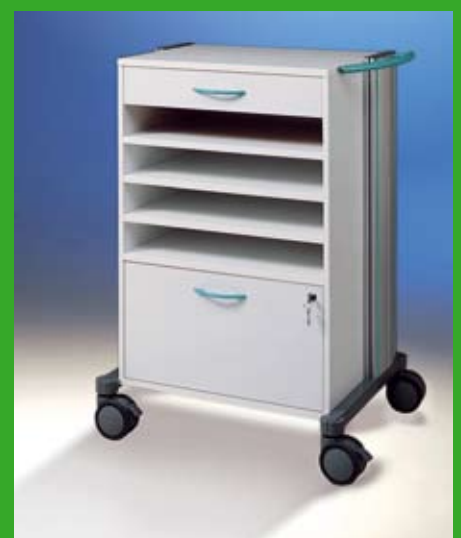
swingo ® -visit Visitenwagen 4 Ref.-Nr. 1357. + Farbziffer