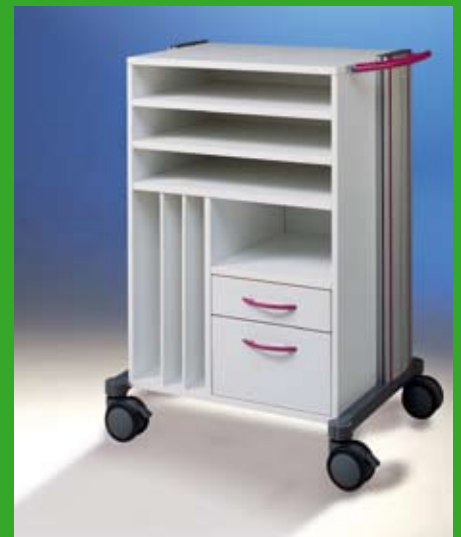
swingo ® -visit Visitenwagen 2 Ref.-Nr. 1356. + Farbziffer